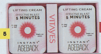
NUXE 50 ml, 19,90 euro. 3. Beauty Pochette Albero di Giada contiene Bagno Gel e Crema Fluida per il corpo. L'ERBORARIO 75 ml cad., 12,90 euro. 4. Aqua Intense 72H, booster biotecnologico che potenzia l'azione dell'acido ialuronico. RILASTIL 40 ml, 24,90 euro. 5. Instant Ageback, crema lifting che cambia lo sguardo in cinque minuti. VITAYVES 26 monodose, 44 euro.

I cosmetici fino a 100 ml non ingombrano, si possono tenere nel bagaglio a mano quando si viaggia in aereo e sono proposti a prezzi vantaggiosi. Caratteristica non trascurabile, che permette di moltiplicare le possibilità di sperimentare, con entusiasmo e senza sensi di colpa, nuove formulazioni. Non solo. Sono diventati una sorta di fenomeno globale nel mondo beauty, come aveva annunciato alla fine dello scorso anno Mintel, l'agenzia di analisi dei consumi, individuando nella Generazione Z (o Post-Millennials) la principale fruitrice delle dimensioni ridotte e tascabili. Oggi, gli stessi analisti parlano di "minimalizzazione" per indicare la necessità crescente di avere cosmetici confezionati in contenitori più piccoli e semplici da usare. Una sorta di mania diventata trasversale, che coinvolge le donne di ogni età puntando sull'essenziale e sull'utilizzo immediato.