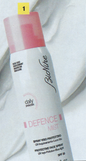
1. Defence Mist, da vaporizzare sul viso, protegge da raggi Uv, smog e luce blu. BIONIKE 75 ml, 14,90 euro. 2. Insta-Masque, maschera detossinante e uniformante al delicato profumo di rosa che agisce in soli due minuti.

Acque micellari, saponi, maschere... Le dimensioni? Tascabili. Per non trascurare mai (e da nessuna parte) la pulizia della pelle